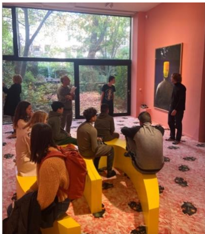
Foam Fotografiemuseum Amsterdam met Kolom Praktijk College Noord.

Dat het ook nog lukte om binnen een dag Mc Reazun en Bruno Filho in te schakelen voor een rap en graffiti workshop op vrijdag en zaterdag voor vluchtelingen die opgevangen worden vlakbij Noordje in St Augustinus was waardevol.