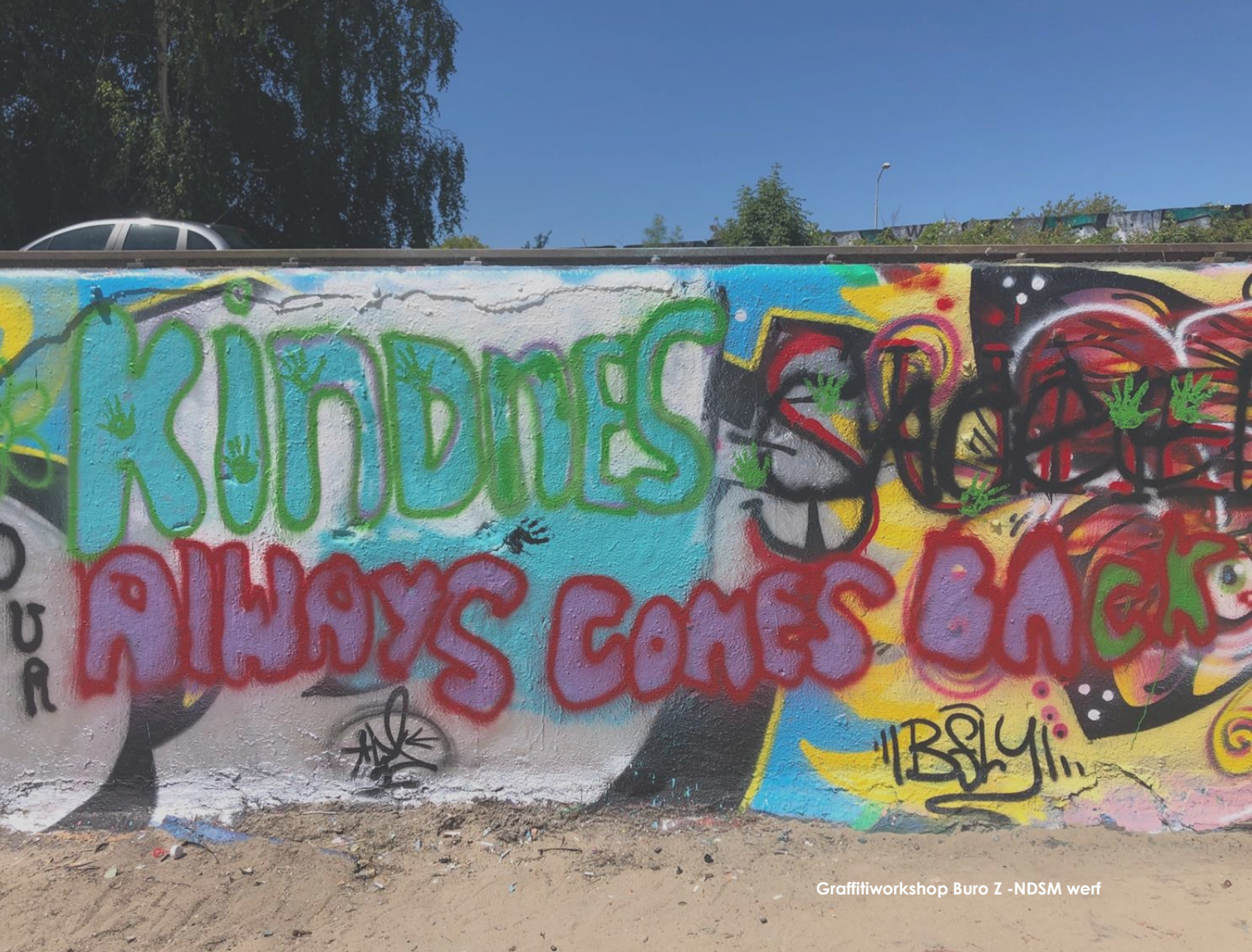
Graffitiworkshop Buro Z -NDSM werf