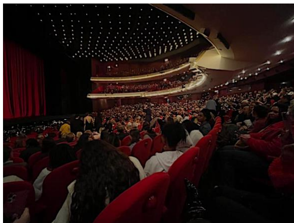
Nationale Opera & Ballet