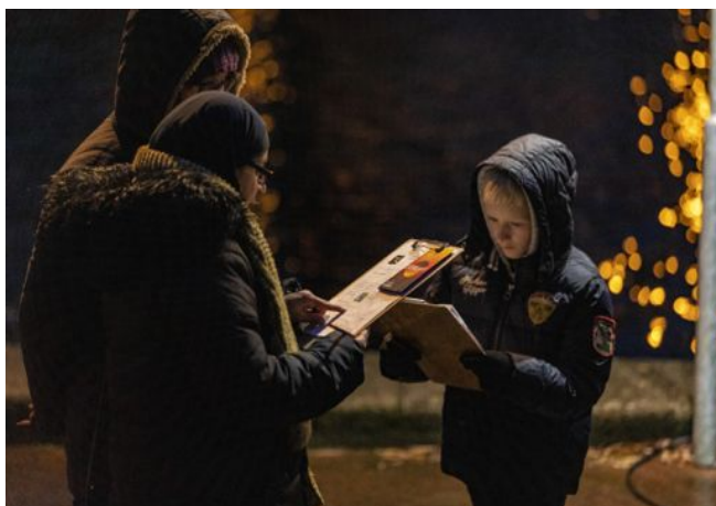
Ouders en kinderen Amsterdam Light Festival