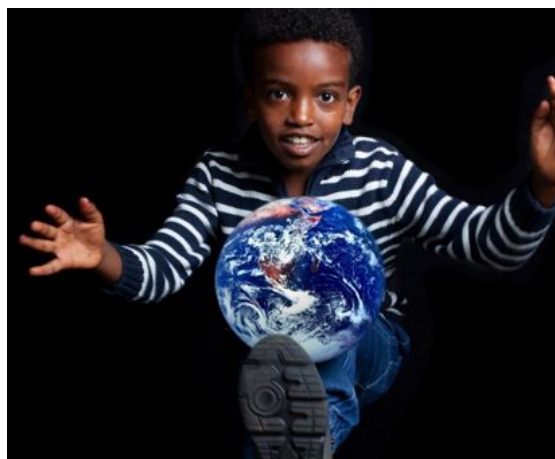
Zomerschool -Staat van het Klimaat