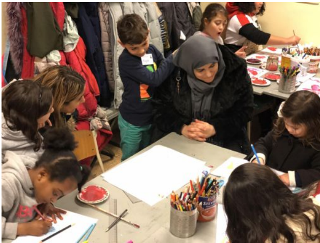
Oudermiddag in het Schrijflab

Het Innovatieve project Amsterdam Schrijflab op School wordt afgerond en afgesloten met een blauwdruk en een presentatie die als basis dienen voor een vervolgtraject op meerdere scholen. Noordje gaat haar Schrijflab in 2020 uitbreiden naar de wijk de Banne in Amsterdam Noord. In 2020 vindt de conferentie van internationale schrijflabs in Kopenhagen plaats in navolging van Noordjes conferentie Word Up! in 2018. In 2020 wordt de Noordjes Kunstacademie uitgebreid om het bereik met betrekking tot talentontwikkeling op gebied van beeldende kunst te vergroten. Een belangrijk aandachtspunt in 2020 wordt ouderbetrokkenheid om te zorgen dat de verbinding met het thuisfront wordt versterkt.