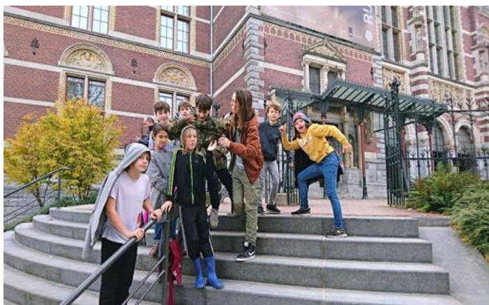
Excursie Kunstacademie voor Jongeren

Een vrijwilliger van 15 die wekelijks begeleiding biedt in het Schrijflab.